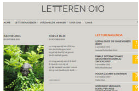
Figuur 1: www.letteren010.nl

Binnen de beperkte begroting van VW communiceren we op effectieve wijze door middel van de website www.letteren010.nl , waarin onder meer een uitgebreide literaire agenda, en een viertal Nieuwsbrieven per jaar.