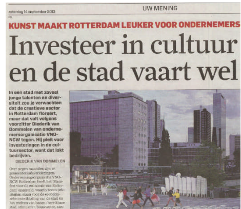
Figuur 3: AD/RD, 14 sept. 2013